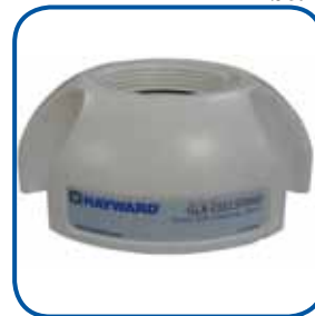
Base de nettoyage Cleaning stand GLX- CELLSTAND

Un pH toujours contrôlé et idéal. Thanks to Aquarite™ Pro, you achieve to have balanced water.