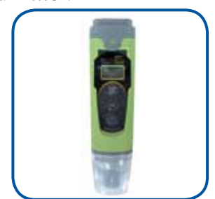
Testeur de sel électronique Saltmeter GLX-SALTMETER