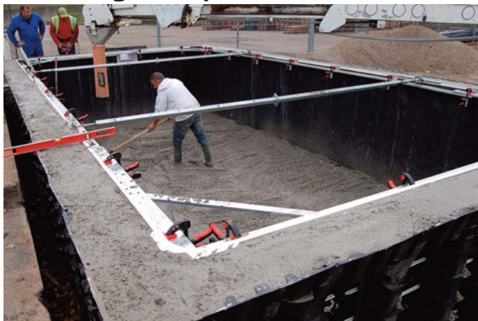
5. Coulage du béton