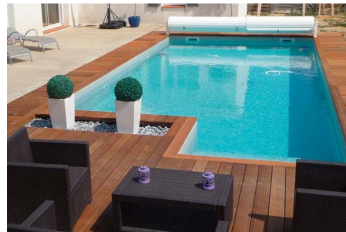
9. Finitions de plage