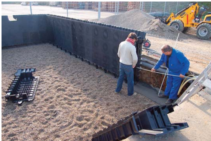
2. Montage des panneaux