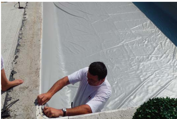
7. Pose du liner