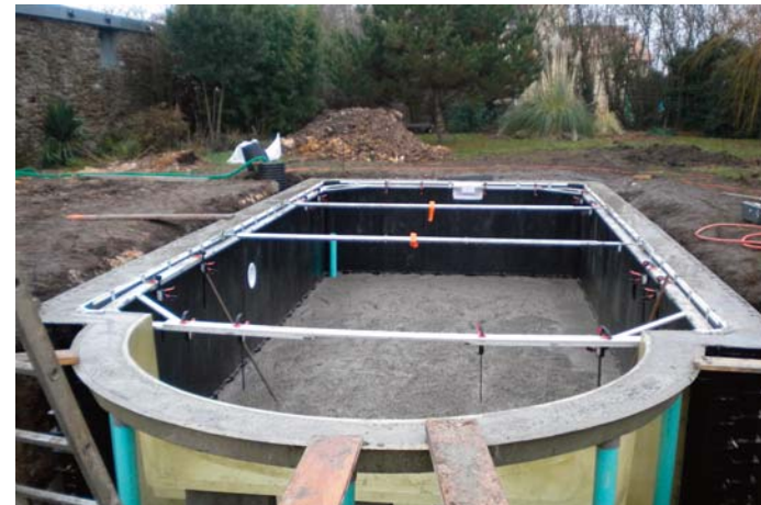
3. Réglages et immobilisation